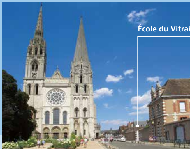
École du Vitrail et du Patrimoine

5, rue du Cardinal Pie 28000 CHARTRES (France) Tél: +33 (0) 2 37 21 65 72 contact@centre-vitrail.org